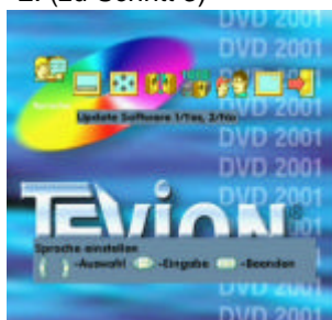
2. (zu Schritt 3)